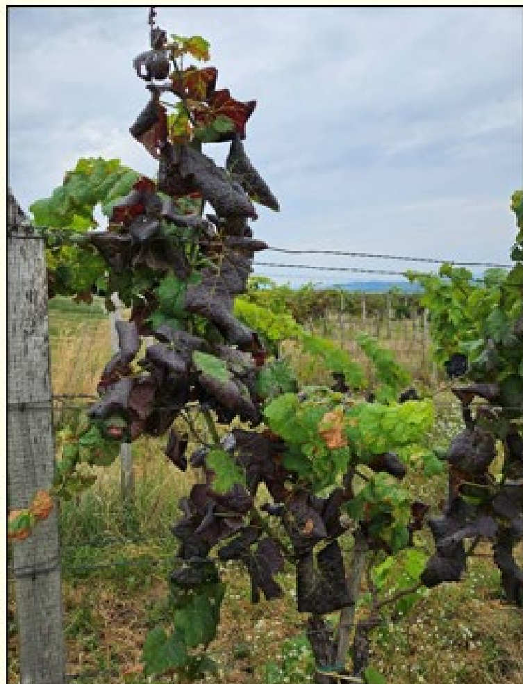
Na modrých odrodách viniča sčervenanie a stáčanie listov nadol