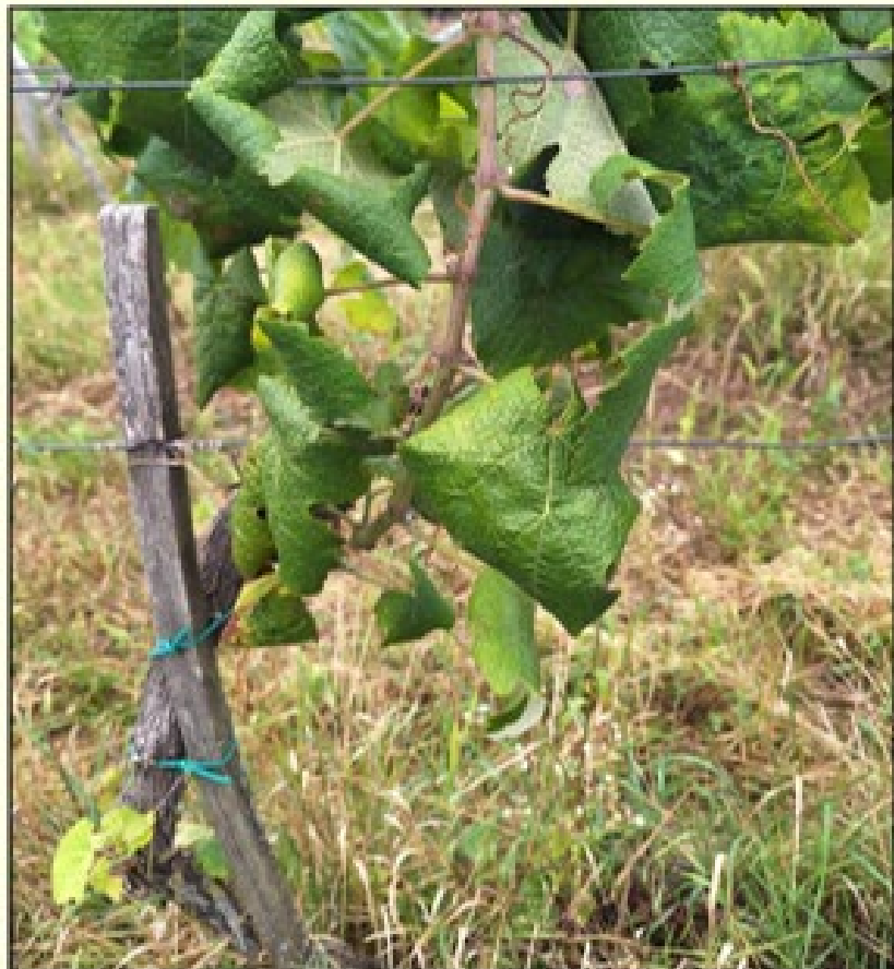
Žltnutie a typické stáčanie listov smerom nadol pri bielych odrodách viniča